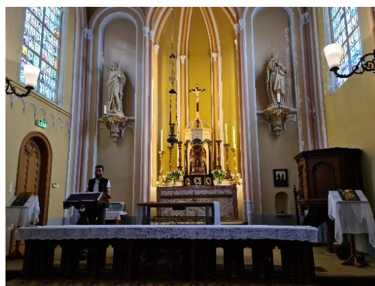
Oud Katholieke kerk Schiedam