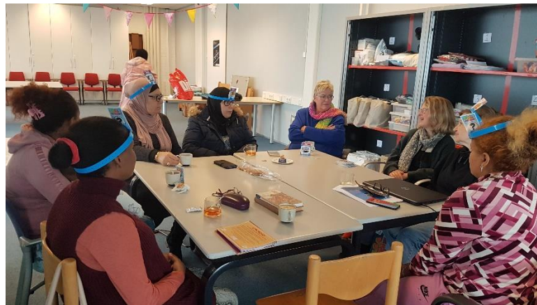
We doen het spelletje "Wie ben ik" en oefenen een half uurtje de Nederlandse taal.