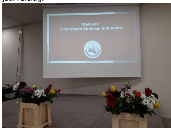
Islamitisch centrum Schiedam

De Stichting Haella overweegt het door hun gefinancierde project op te nemen als voorbeeldproject in hun jaarverslag.